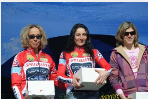
Il podio della gara femminile